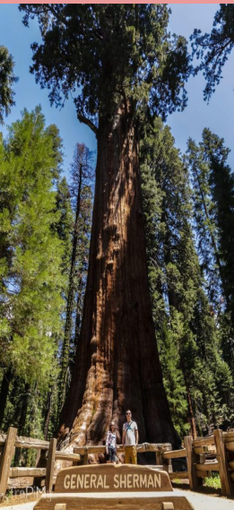
Sekwoja - najwyższa na świecie