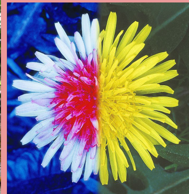
Czy to prawdziwy kwiat, czy grafika?