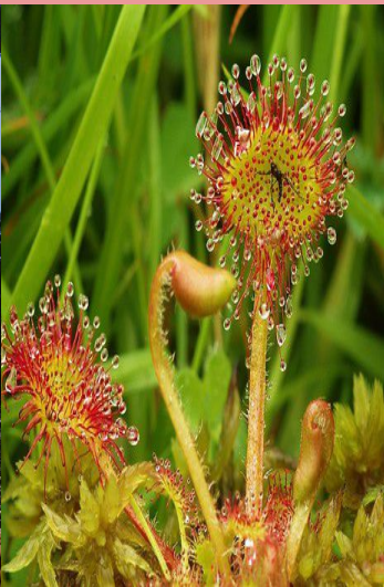
To są rośliny drapieżne, które żywią się owadami.