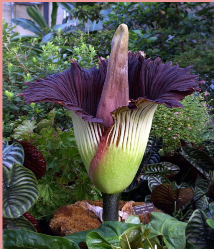
Dziwidło olbrzymie, kiedy kwitnie wydziela zapachi jak padlina.