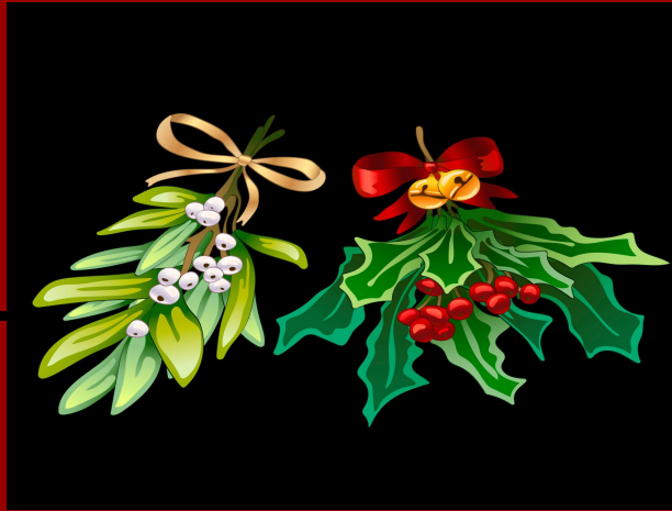
Jemiola i ostrokrzew

Czy znacie te piękności? Co roku ozdabiają nasze domy w okresie Świąt Bożego Narodzenia.